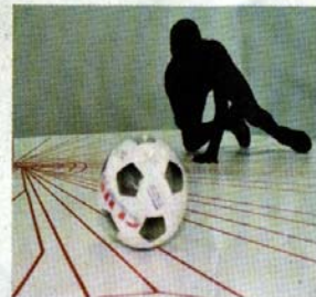
Performance-Lounge von Carlos Amorales, 2001